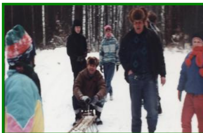
Mieszkańcy Sędowa podczas kuligu w pobliskim lesie

W latach 90-tych, po mimo braku świetlicy wiejskiej, mieszkańcy bardzo często sami organizowali czas wolny dzieciom aktywnie uczestnicząc w przygotowywaniu zabaw i rozrywek. W okresie ferii zimowych co roku przygotowano kulig.