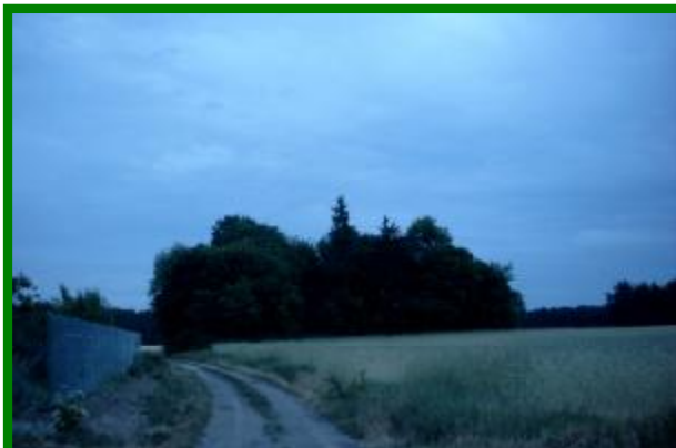
Widok na cmentarzysko

sołectwa, będzie wykonanie tablic upamiętniających te miejsca spoczynku zmarłych.