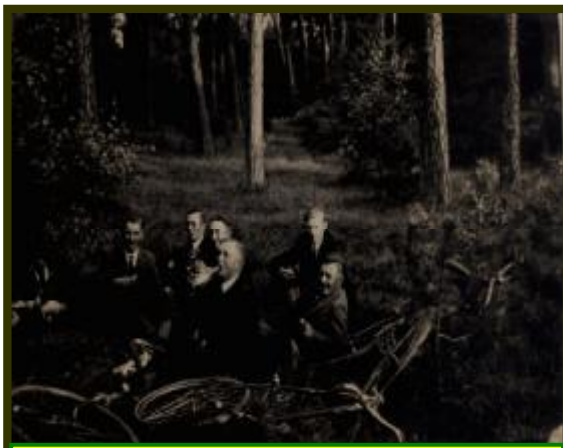
Rajd rowerowy – wiosna 1938r.

W latach powojennych społeczność wsi Sędowo działała bardzo aktywnie. Organizowano wiele imprez plenerowych, oraz zabaw w istniejącej obecnie świetlicy. Dowodem tego są nielicznie zachowane fotografie.