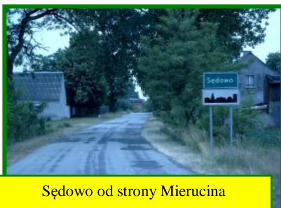
Sędowo od strony Mierucina

Sędówka, Broniewiczek i Szubinka. Między każdą osadą i jest około 1km. Natomiast Centralnym miejscem miejscowości jest Sędowo gdzie znajduje się dawna szkoła.