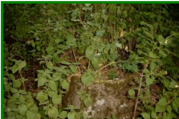
Nieliczne płyty grobowe

Sędowo, to miejscowość posiadająca bezpośredni dostęp do lasu. Podnosi to w znaczny sposób atrakcyjność miejscowości. Kolejnym zadaniem byłoby utworzenie ścieżek rowerowych po najbardziej atrakcyjnych częściach lasu oraz łączącej poszczególne osady tj. Sędowo, Sędówko, Szubinek Broniewiczki, oraz w szczególności miejsce wykopalisk, dawną szkołę polską, jak również niemiecką, pałac, kuźnię, młyn, cegielnię, miejsca pochówku które położone są przy wszystkich osadach, zrehabilitowany sad. Ponadto, wzdłuż ścieżki rowerowej przewiduje się postawienie tablic informacyjnych opisujących i