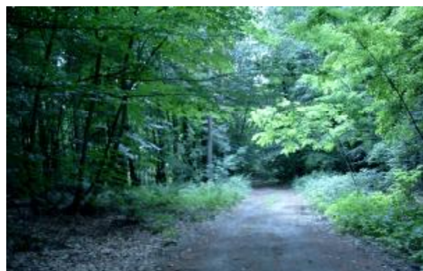
Sędowo – droga leśna

Sędowo, to miejscowość posiadająca bezpośredni dostęp do lasu. Podnosi to w znaczny sposób atrakcyjność miejscowości. Kolejnym zadaniem byłoby utworzenie ścieżek rowerowych po najbardziej atrakcyjnych częściach lasu oraz łączącej poszczególne osady tj. Sędowo, Sędówko, Szubinek Broniewiczki, oraz w szczególności miejsce wykopalisk, dawną szkołę polską, jak również niemiecką, pałac, kuźnię, młyn, cegielnię, miejsca pochówku które położone są przy wszystkich osadach, zrehabilitowany sad. Ponadto, wzdłuż ścieżki rowerowej przewiduje się postawienie tablic informacyjnych opisujących i