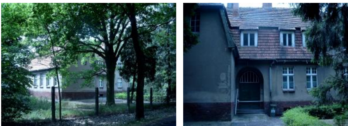
Sędowo – budynek byłej Szkoły Podstawowej

W 1994 r. została zamknięta Szkoła Podstawowa w Sędowie. Jedna z klas została zaadoptowana jako świetlica wiejska. Od tego momentu młodzież miała miejsce spotkań, co pozwoliło na samodzielne przygotowanie przedstawienia „Jasełka” w okresie przedświątecznym. W świetlicy organizowano również dyskoteki dla dzieci i młodzieży w okresie letnim.