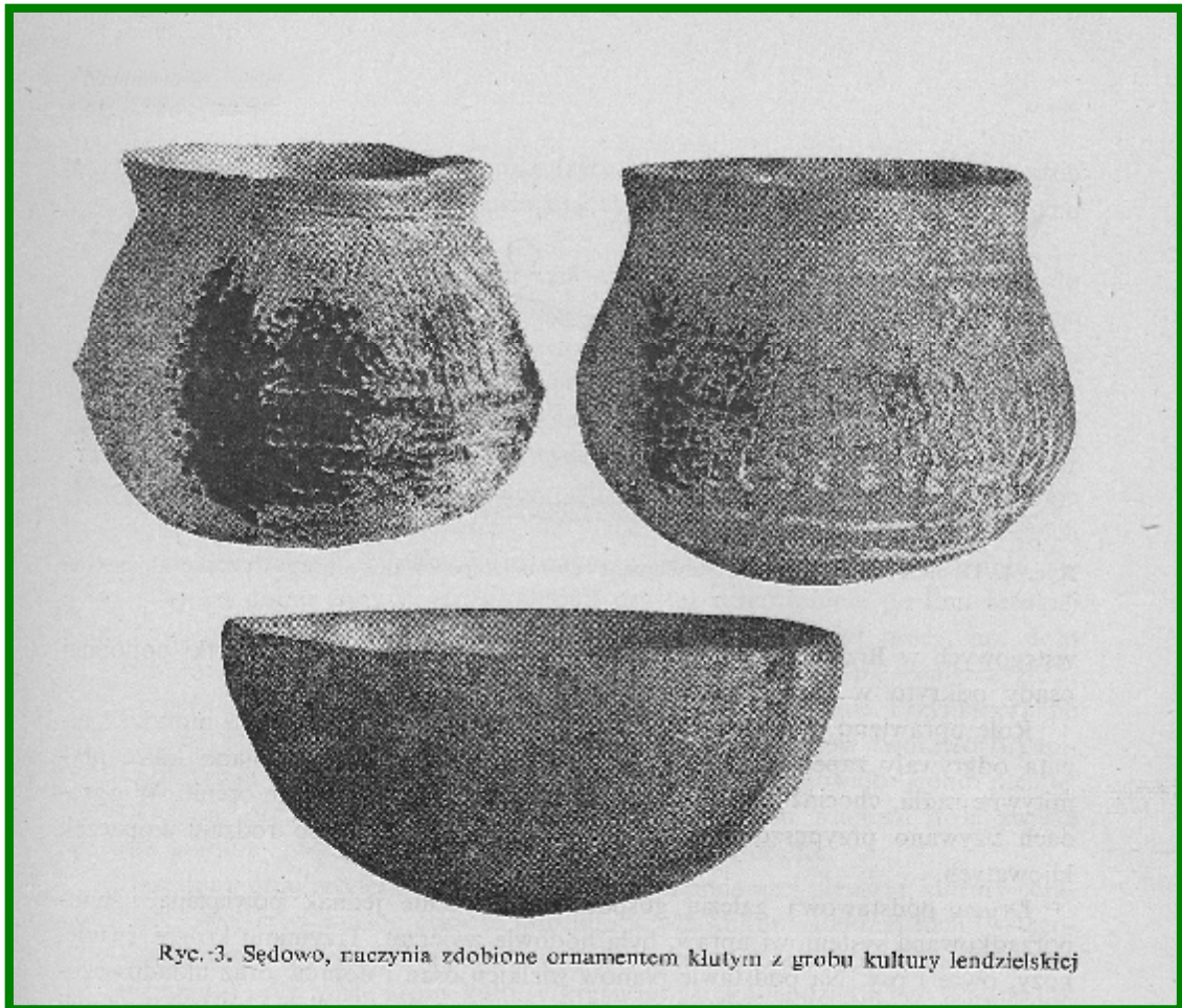
Ryc. 3. Sędowo, naczynia zdobione ornamentem kłutym z grobu kultury lendzielskiej