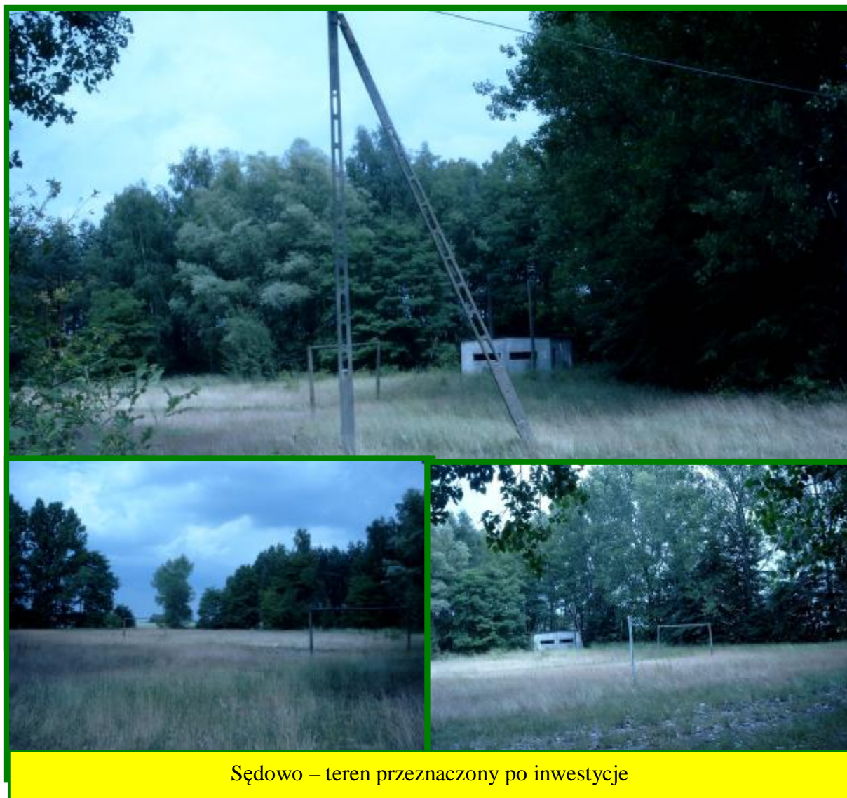
Sędowo – teren przeznaczony po inwestycji

Priorytetem w obecnych czasach dla mieszkańców wsi Sołectwa jest podjęcie wszelkich działań aby poprawić niekorzystne warunki, jakie znajdują się w ich miejscowości. W tym celu mieszkańcy zamierzają podjąć szeroki zakres różnorodnych działań w celu polepszenia ich życia a w szczególności dla mieszkańców wsi, którzy pozostali na miejscu i chcą tutaj dalej mieszkać.