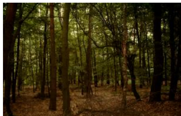
Sędowo - las

upamiętniające poszczególne miejsca, jak również zagospodarowanie kilku miejsc odpoczynku dla osób zwiedzających.